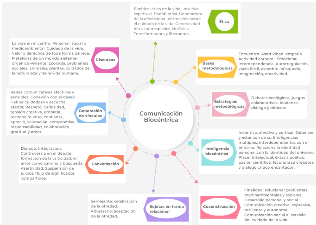
Mapa Mental 1. La comunicación biocéntrica

Elaboración propia a partir de Maturana, 1990; Maturana y Varela, 1984, Naranjo, 2009, 2010; Varela, 1990, 1992; Freire, 1970; Toro, 2005; Perlo, 2019a, 2019b, 2013; Calvo, 2012; Mawa, 2014; Moreno et al. , 2014; Kaplún, 2001, 1985; Alba, 2020, Novoa y Pirela, 2020; Libuy y Niebles, 2020; Murillo y Mateos, 2021; Niebles, 2021; Rueda y López, 2013; Johnson-Mardones, 2018; Serrano, 2011; Abad, Castillo y Orizia, 2014; Bohm y Peat, 1988; Rizzo, 1997; Yontef, 2002.