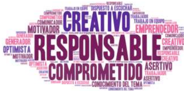
Figura 2. Características de un buen líder

En cuanto a las características de un buen líder, la muestra mencionó las siguientes: