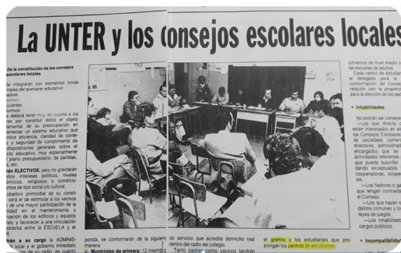
Figura N° 2: Participantes en asamblea