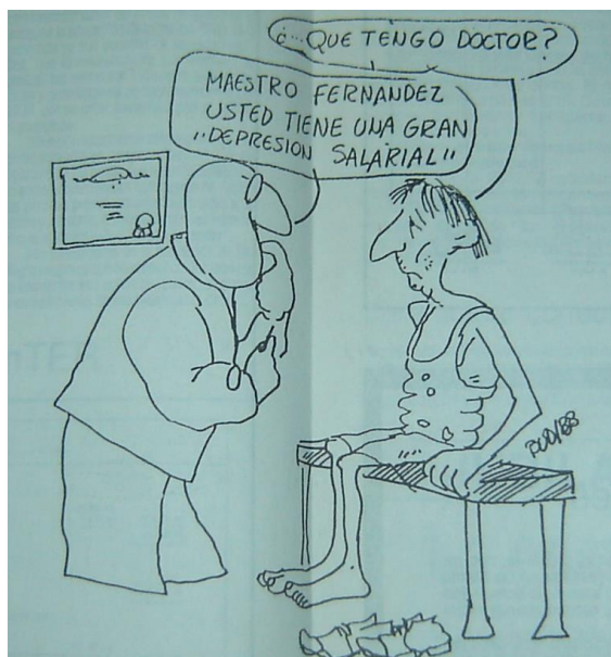
Figura N° 4: La salud docente en estado crítico

En el artículo, “ La salud de los trabajadores de la educación ” (9) Balmaceda planteaba la identidad de los docentes como trabajadores que defienden sus derechos a tener un salario digno y condiciones de vida y trabajo que garanticen el bienestar y la salud del colectivo. La imagen que acompaña el artículo periodístico es una caricatura que refleja apelando al humor la crítica situación de la docencia.